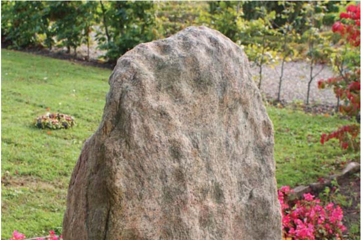
På bagsiden af fællesmindestenen på Kværkeby kirkegård er der indhugget 36 skåltegn. Hvorfra stenen oprindelig stammer, vides ikke.

Skåltegn er den ældste og mest udbrede helleristning i Danmark. De små runde fordybninger er som regel indhugget i større stenblokke - bl.a. på overliggeren på dysser. De fleste skåltegn stammer fra bronzealderen, men skikken går tilbage til bondestenalderen. Skåltegn menes at have en rituel betydning. De kendes også fra andre dele af Europa.